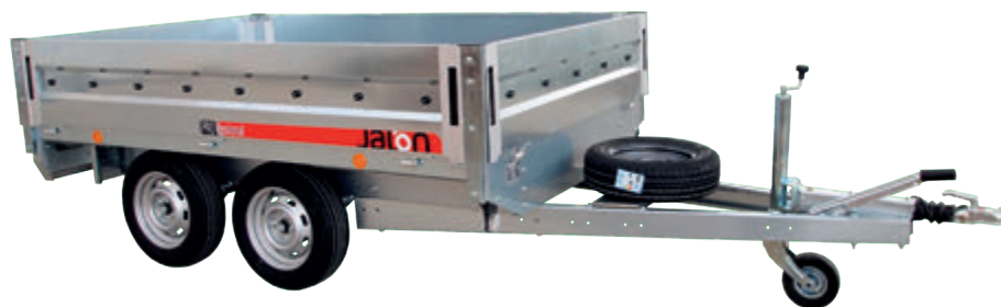
Rueda de repuesto