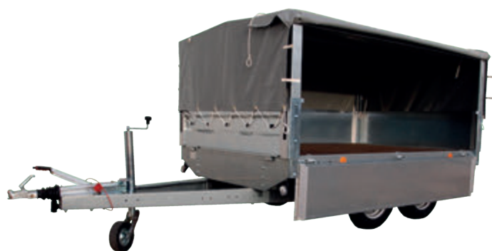
Arquillos y lona

Consulte las características por modelo en la tabla siguiente