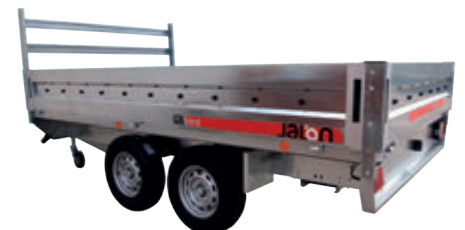
Ref. B02010 Porta escaleras